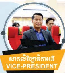
សាតលីវិច្ឆ័យតិចារី VICE-PRESIDENT