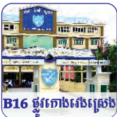
B16 ផ្លូវកោងស្រែង