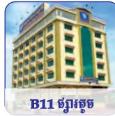
B11 ផ្សារត្នូល