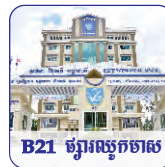
B21 ផ្សារល្អិតល្អន់