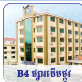
B4 ផ្សារបើកផ្លូវ