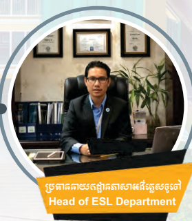
ប្រធានតាមរតនាខាអង់គ្លេសទូទៅ Head of ESL Department