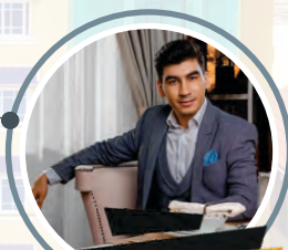
ប្រធានផ្នែកទំនាក់ទំនងសាធារណៈ Public Relations Manager