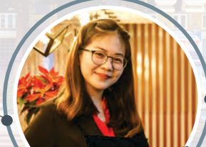
សាស្ត្រាចារ្យប្រចាំមន្ទីរ LECTURER