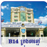
B14 ក្រុងគោរ្ម