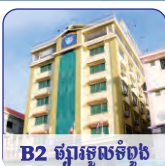
B2 ផ្សារត្នូលត្នូល