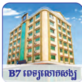
B7 ទេសចរណ៍ស្បែក