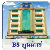
B5 ច្បារអំពៅ