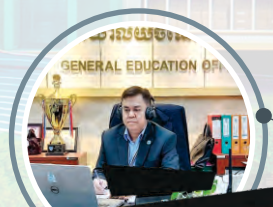
ប្រធានតាមរតនាខាចំនេះទូទៅ Head of GEEd Department