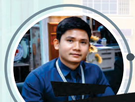
សេគុប្រធានផ្នែកប្រចាំផ្នែកវិទ្យុទស្សន៍ Deputy Manager of Media Department