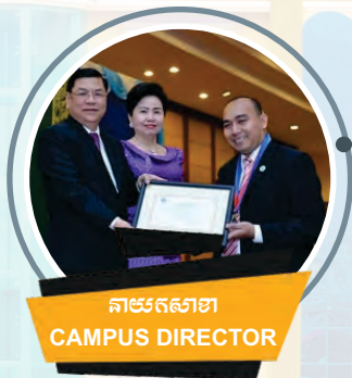
តាមរតនាខា CAMPUS DIRECTOR