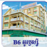
B6 ផ្លូវប្រសើរ