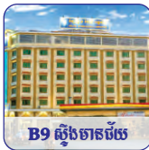
B9 ផ្លូវចាត់ចែង