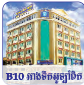
B10 អាងទឹកអូរព្រៃ