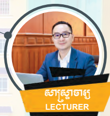
សាស្ត្រាចារ្យ LECTURER