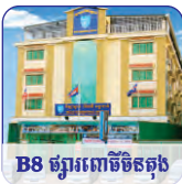
B8 ផ្សារពោធិ៍ចិត្ត